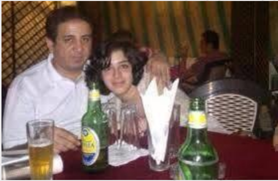
علياء المهدي مع كريم عامر

لم تكن علياء ذات صدى يُذكر قبل نشر صورها العارية، ولكنها بعد نشرها للصور مباشرة قفز عدد متابعيها على موقع فيسبوك من عدة مئات فحسب إلى عشرات الآلاف وحصلت بعض صورها على أكثر من مليون مشاهدة 53 . وأثارت ضجة عارمة في الشارع والإعلام المصري بشكل غير مسبق، وسمّتها مجلة Elle الفرنسية "أيقونة منبوذة" 54 .