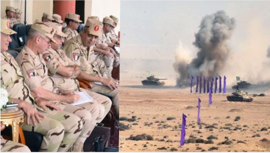
3- المنطقة الجنوبية تشهد تدريبات بمشاركة أفرع مختلفة:

بدأ البيان بكلمة اللواء أركان حرب محمد ربيع قائد الجيش الثاني الميداني أشار خلالها إلى أن رجال الجيش الثاني الميداني محافظين على أعلى درجات الاستعداد والجاهزية لتنفيذ أي مهام توكل إليهم لحماية أمن مصر القومي، مؤكداً أنهم لا يدخروا جهداً لحماية أرض مصر ومقدرات شعبها.